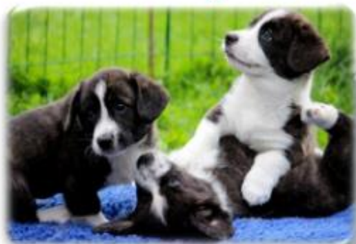
Shepados Astrid Lindgren kullet 2017