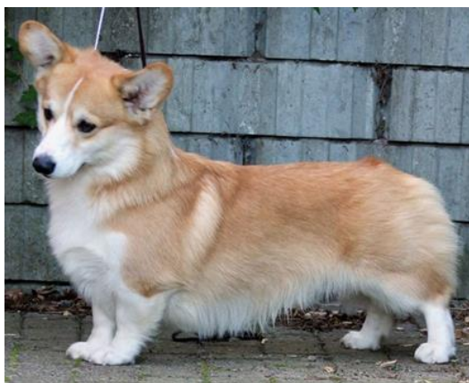
Ny Internasjonal Champion C.I.B. NORD N SE DK UCH NJV-15 Bronn Chernovodny Eier: Jane Serigstad