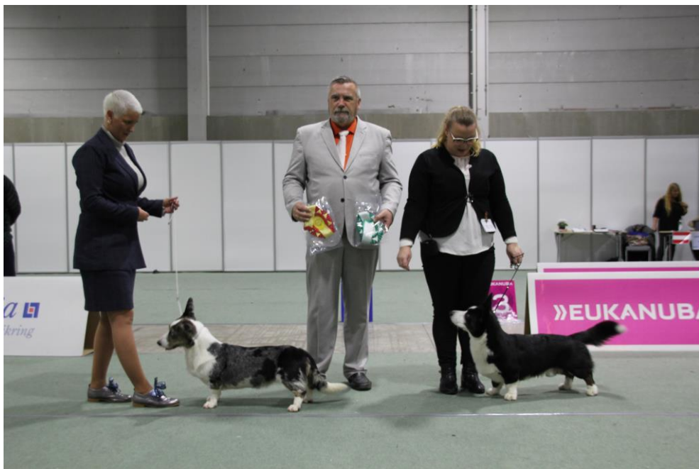
BIR – BIM Dogs4all