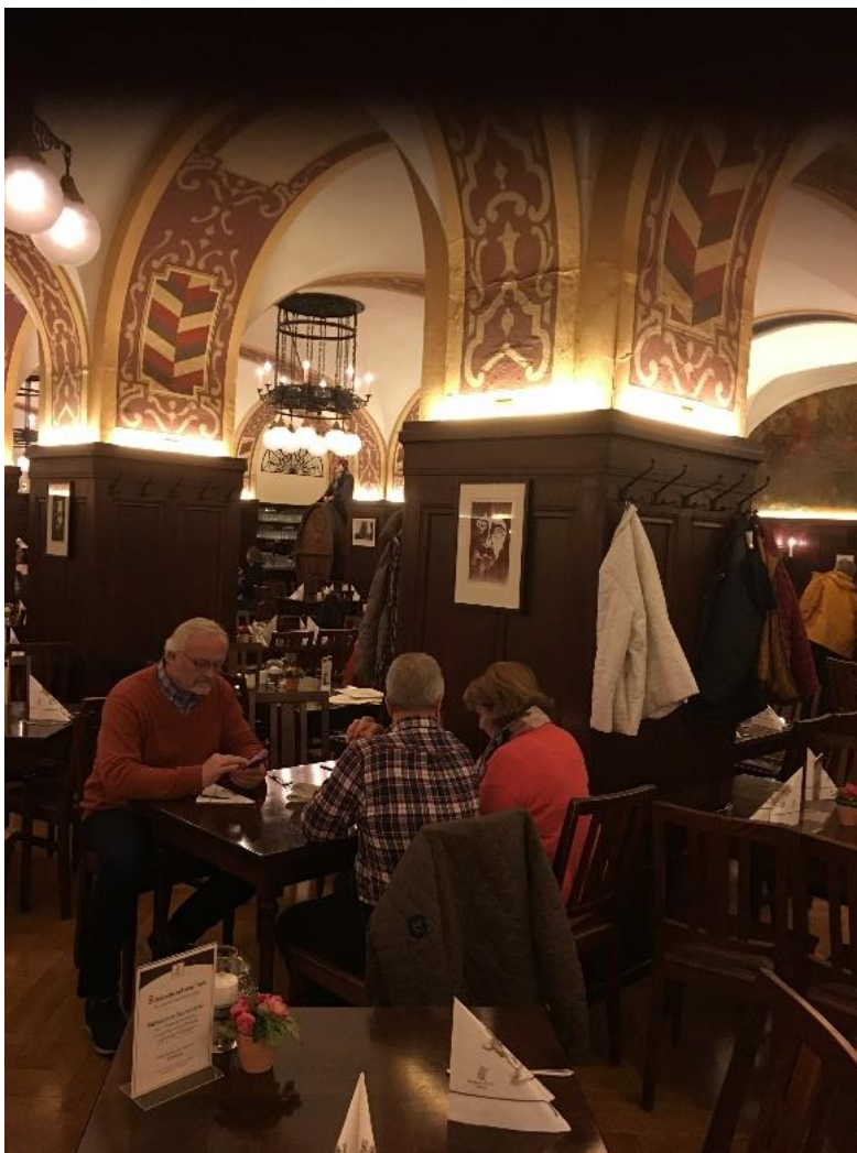
Her inntar vi et deilig måltid i Auerbachs Keller, den mest berømte restauranten i Leipzig, kjent for sine Faustfigurer og malerier