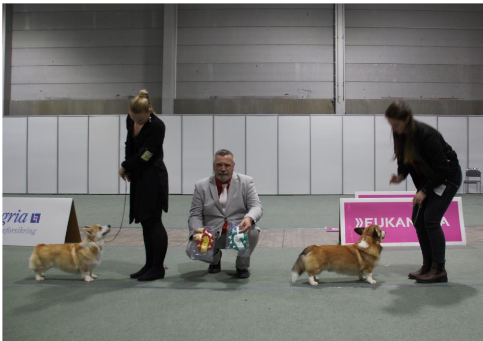
BIR – BIM Dogs4all