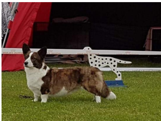
Ny Dansk Champion,ny Nordisk Champion: N S DK Nord UCH SeV-16 Miss Moneypenny Cymraeg Ci