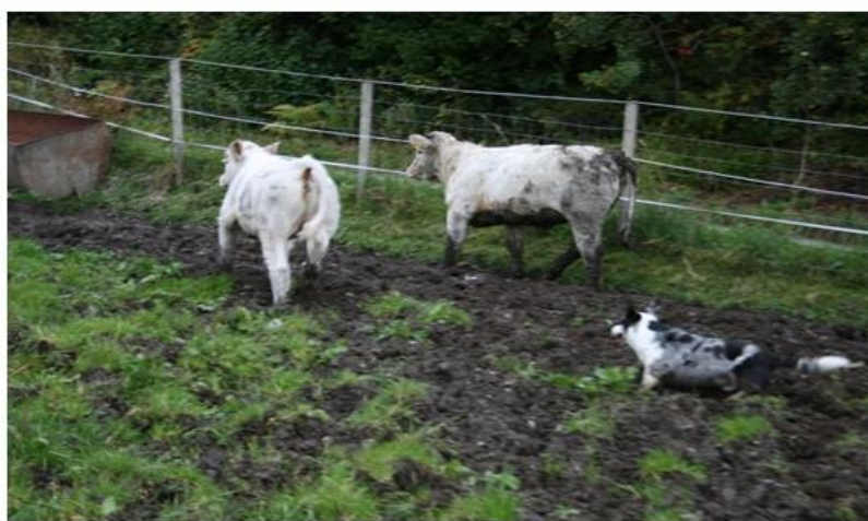
Og jammen fikk han ikke snudd de rett vei, og “fulgt” helt inn i fjøset! Det er ikke alltid det er kjekt med korte bein. Ikke i opptråkket gress og gjørme.

Kanskje man rett og slett skulle blitt med på gjeterkurs med corgien? Tekst og Foto; Janne Linnerud