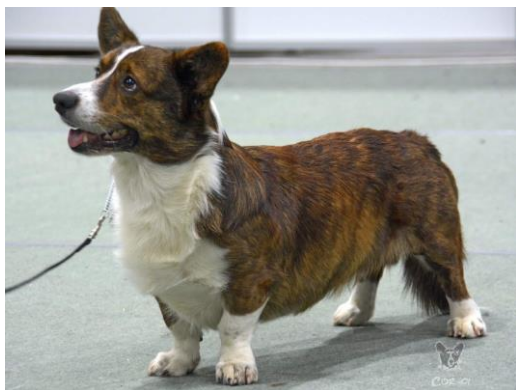
Ny Norsk Champion,ny Dansk Champion,ny Nordisk Champion: N S DK Nord Ch SeV-16 Shepados Hot & Gentle.