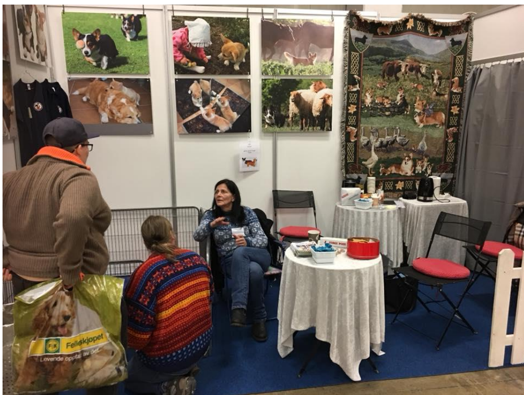
Glimt fra NWCKs stand på rasetorget under Dogs4All

I klubben har vi nettopp vært igjennom en maratonhelg i forbindelse med Dogs4All. Vi hadde tre dager med stand på Lillestrøm. Alle dager var det stor tilstrømming av folk til standen og de stilte de merkeligste spørsmål. Men våre flinke medlemmer hadde alltid et svar og turnerte de aller vanskeligste spørsmålene med bravur.